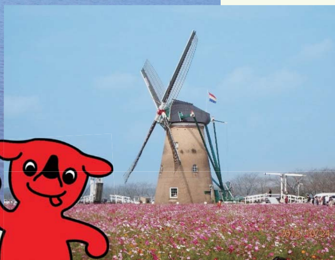
佐倉ふるさと広場