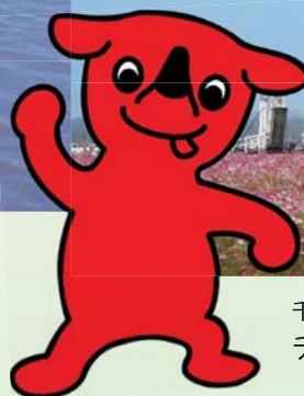
千葉県PRマスコットキャラクター チーバくん